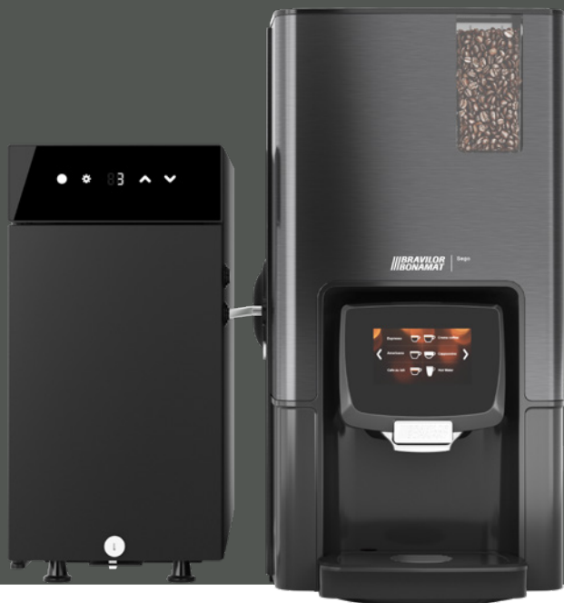
Sego L met melkkoelkast