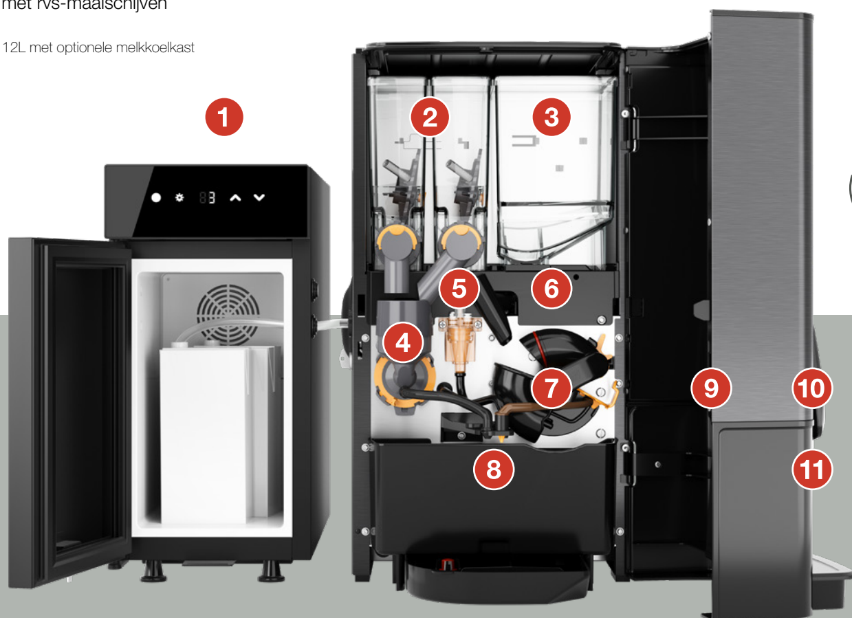
Sego 12L met optionele melkkoelkast