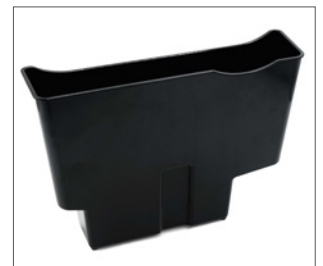
afvalbak voor verhogingstableau