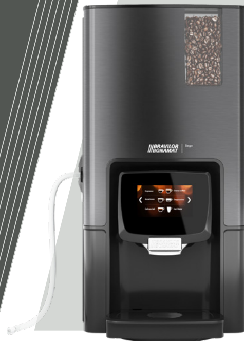
Sego L zonder melkkoelkast