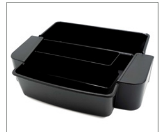
lekbak voor verhogingstableau